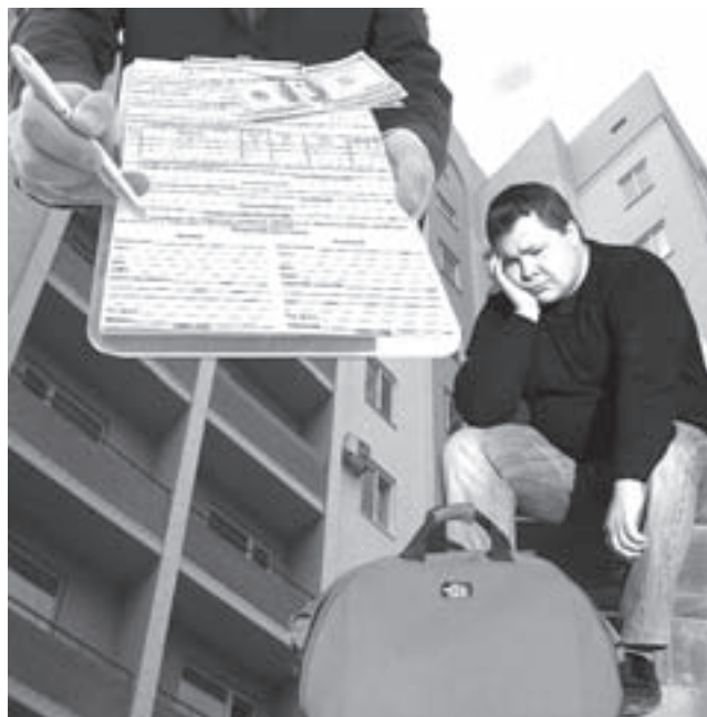
КОЛЛАЖ ВАЛЕРИЯ БАКЛАНОВА

Мошенники запросто могут украсть паспорт, другие документы и продать вашу квартиру доверчивым людям, да еще не одному. А черный риэлтор мошенническую сделку