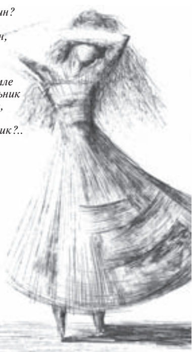
РИСУНОК ВЛАДИМИРА ЛИСИЦЫНА.

Мы по-прежнему ждем от читателей газеты стихотворений (не более трех). Их можно отправить по электронной почте: e-mail: isaeva@grani21.ru, прислать по адресу: Новочебоксарск, ул. Советская, 14а или принести в редакцию.