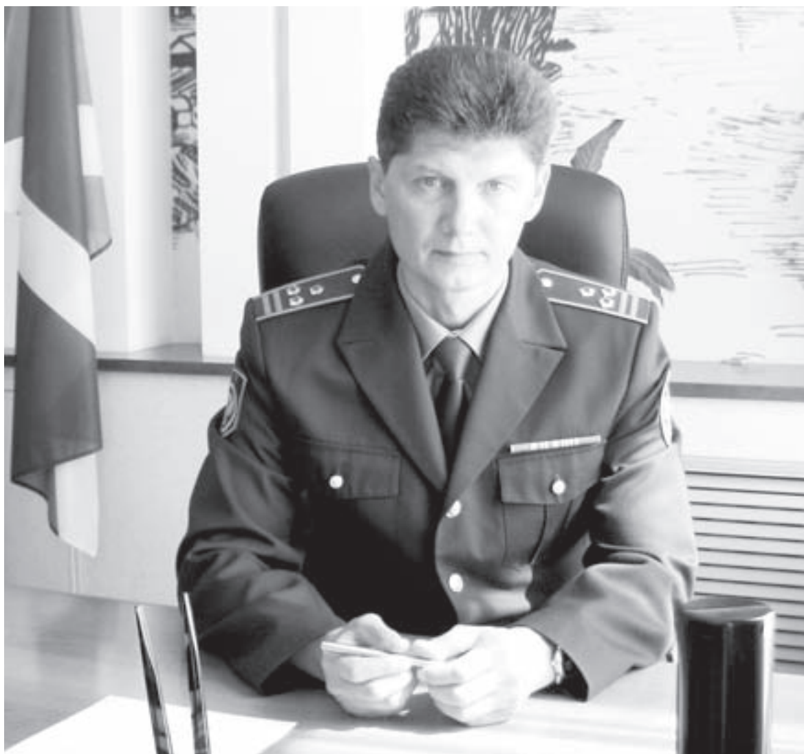
НАЧАЛЬНИК ЧУВАШСКОЙ ТАМОЖНИ ПОЛКОВНИК ТАМОЖЕННОЙ СЛУЖБЫ АЛЕКСАНДР МОРОЗ.

— При ведении внешнеэкономической деятельности всегда существует риск, что кому-то захочется укрыть сведения о товаре или самой сделке для минимизации издержек, другими словами, уклониться от уплаты таможенных платежей в федеральный бюджет. Для противодействия таким попыткам в структуре таможни есть отделы административных расследований и оперативно-розыскной, отде-