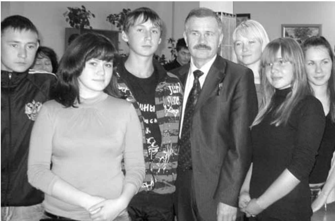
Н. Бударин с учащимися ЧХМТ.

Во вторник депутат Госдумы РФ от Чувашии летчик-космонавт, Герой России Николай Бударин посетил в Новочебоксарске одно из старейших учебных заведений города — ЧХМТ.