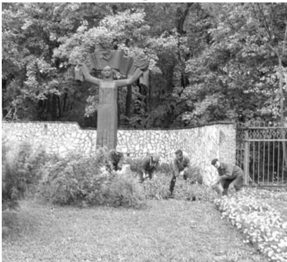
РАДУШНО ВСТРЕЧАЕТ БОГИНЯ ФЛОРА.