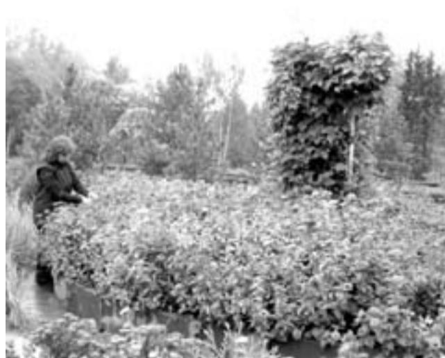
...ПОТОМ НА ОПЫТНОЙ ДЕЛЯНКЕ.

30 — те, что произрастают в республике. Есть и редкие. Например, растут абрикосы, дают и плоды. Они уже адаптированы к нашим условиям, даже суровую зиму прошлого года выдержали.