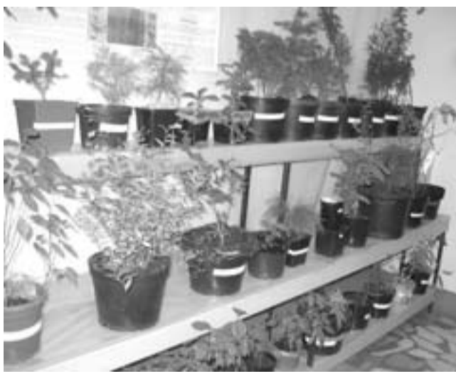
СНАЧАЛА В ГОРШКАХ...

Ботанический сад богат коллекцией плодово-ягодных растений, только яблонь здесь около 60 сортов, а малины более