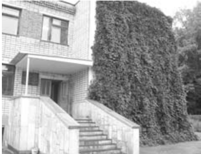
АДМИНИСТРАТИВНОЕ ЗДАНИЕ В ДЕВИЧЬЕМ ВИНОГРАДЕ.