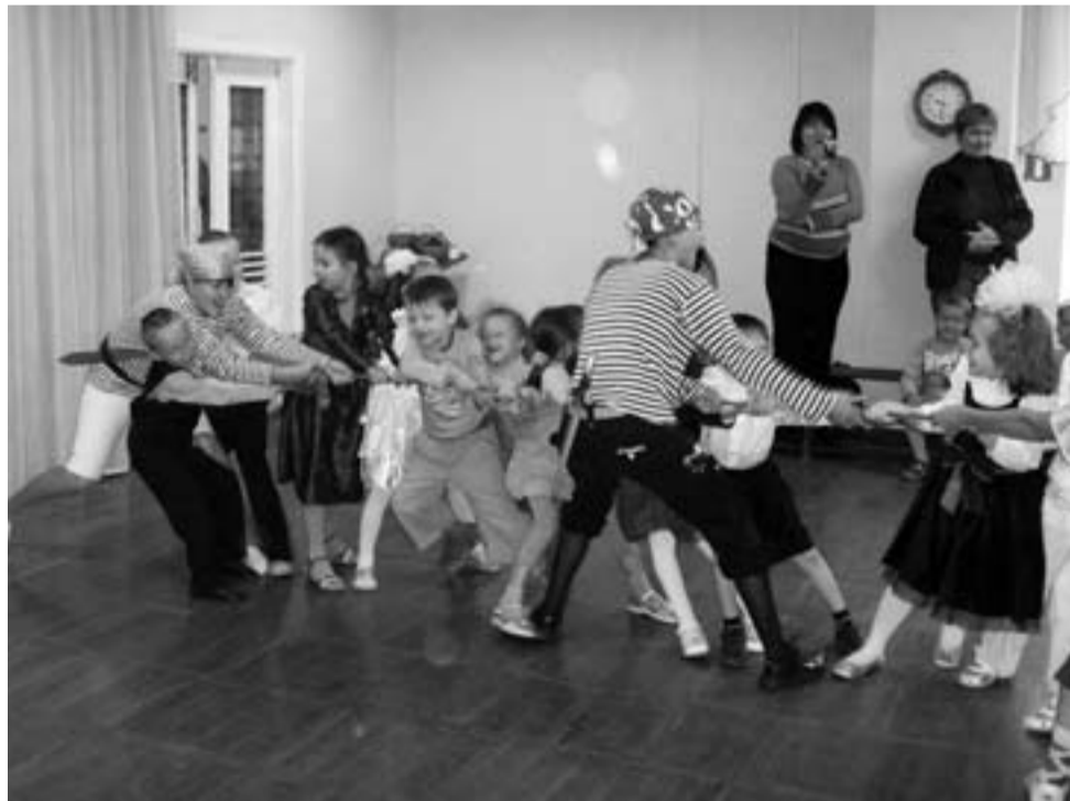
СОСТЯЗАНИЕ С ПИРАТАМИ.

Увлекательное путешествие на остров Знаний совершили 1 сентября воспитанники детского сада № 40 “Радость”.