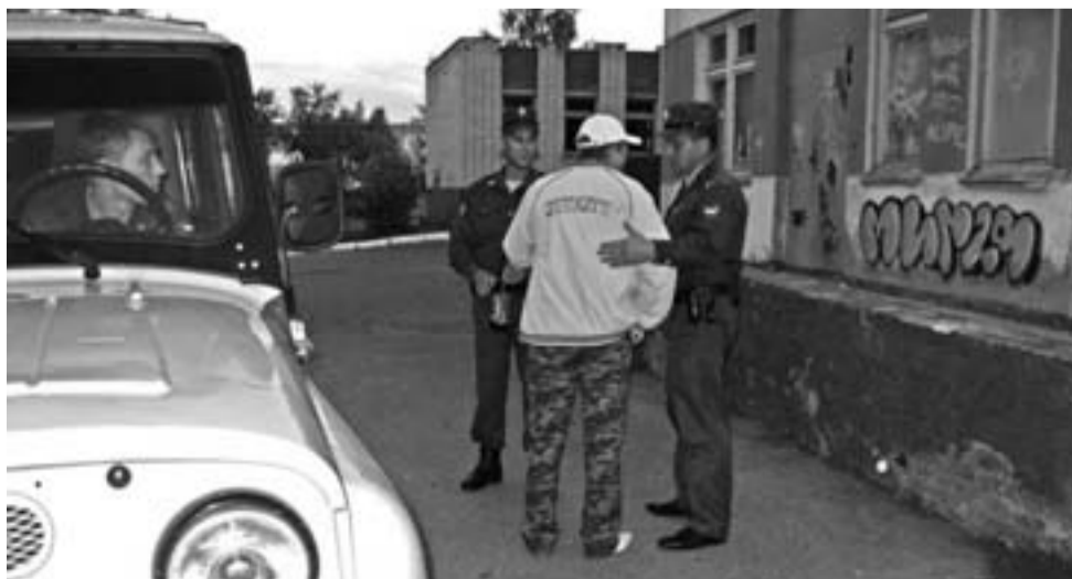
ОГРАНИЧИЛИ ПРЕДУПРЕЖДЕНИЕМ: РАСПИВАТЬ ПИВО НА ТЕРРИТОРИИ БОЛЬНИЦ, ШКОЛ, ДЕТСКИХ САДОВ ЗАПРЕЩЕНО.