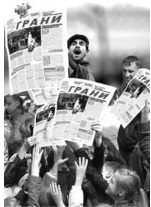
Коллаж Валерия Бакланова.

А какие идеи есть у вас? Пишите! Итоги конкурса подведем в конце года. Автор лучшей идеи будет награжден призом и го-