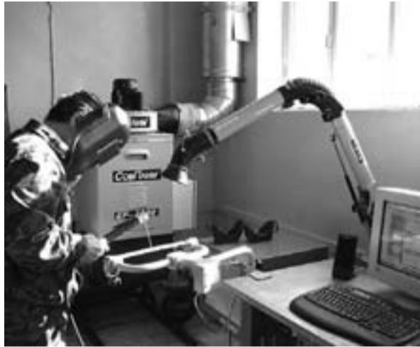
Аппарат, имитирующий сварку, контролируется компьютером.