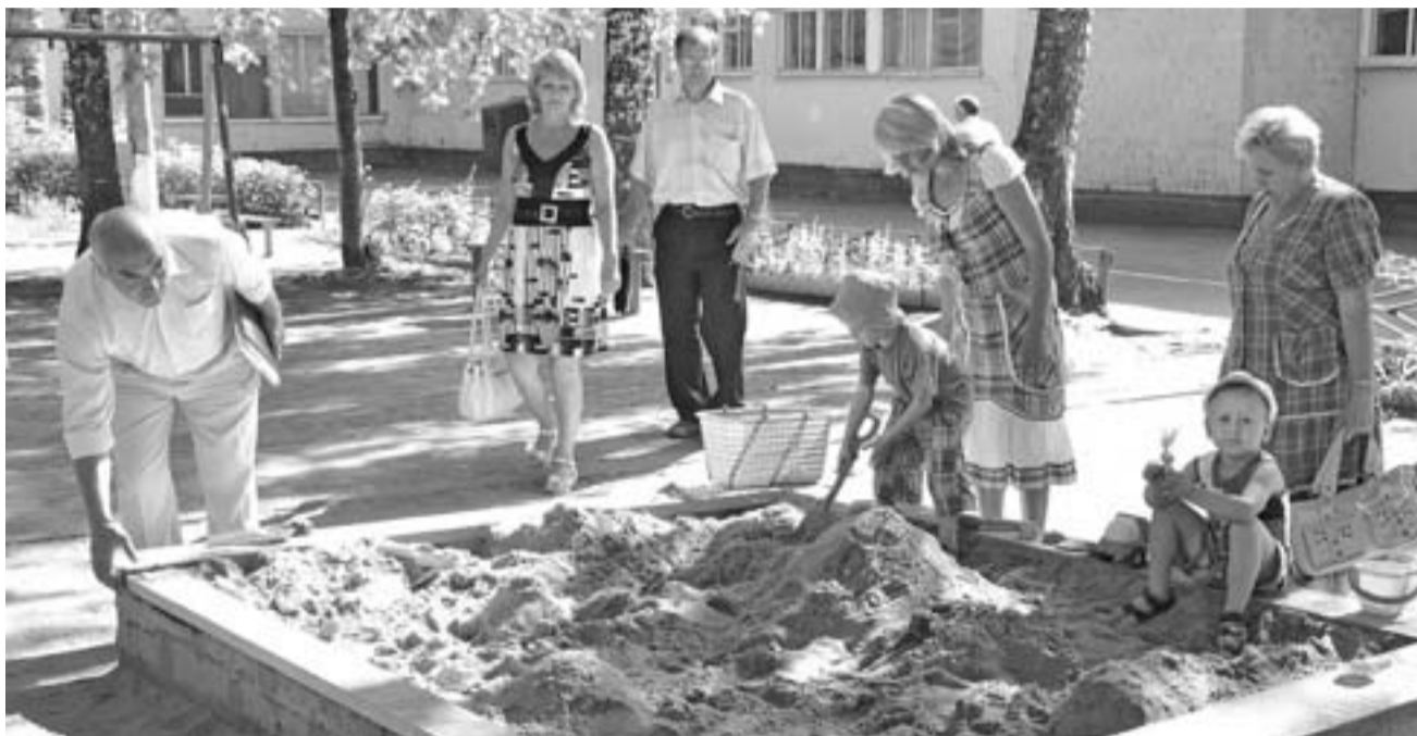
Строгая комиссия.

В понедельник началась проверка готовности детских садов Новочебоксарска к новому 2010-2011 учебному году. Комиссия, в составе которой сотрудники МЧС, Роспотребнадзора, ОВД, детской поликлиники, администрации города, проверит 41 дошкольное учреждение.