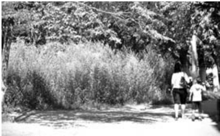
КОМФОРТНО ЧУВСТВУЕТ СЕБЯ В ЖАРУ... ЛЕБЕДА — ВОН КАК ВЫМАХАЛА: ВЫШЕ ЧЕЛОВЕЧЕСКОГО РОСТА.