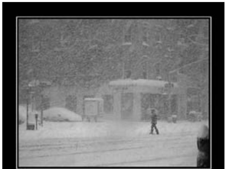
А помнишь как ты хотел лето?

Большинство пользователей Интернета ненавидят рассылку «писем счастья». Не зря считают их спамом, так как в них требуется передать сообщения друзьям, иначе тебя ждут беды. Хотя основное содержание некоторых текстов заслуживает внимания. На нашем сайте недавно появился такой перепост. Он рассказывает о польке, спасшей в годы второй мировой войны жизни двух с половиной тысяч еврейских детей. Эту женщину в прошлом году номинировали на Нобелевскую премию мира, но избрали другого человека. Узнать более подробно об Ирине Сэндлер можно в блоге Marietta ( http://www.grani21.ru/blog-marietta/posmotrite-i-zapomnite-jetu-zhenshhinu ). Заметка особенно актуальна сейчас, когда отмечается 65-летие окончания войны с фашизмом.