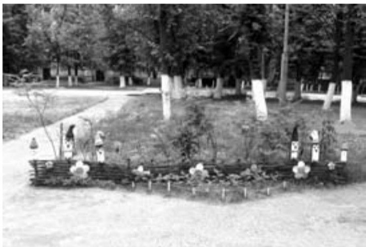
ВООБЩЕ, ЕСЛИ РУКИ ПРИЛОЖИТЬ, И НА МАРСЕ БУДУТ ЯБЛОНИ ЦВЕСТИ. ТОМУ ПРИМЕР НЕКОГДА ЗАБРОШЕННЫЙ УГОЛОК НАПРОТИВ ДОМА № 33 ПО УЛ. ПАРКОВОЙ.