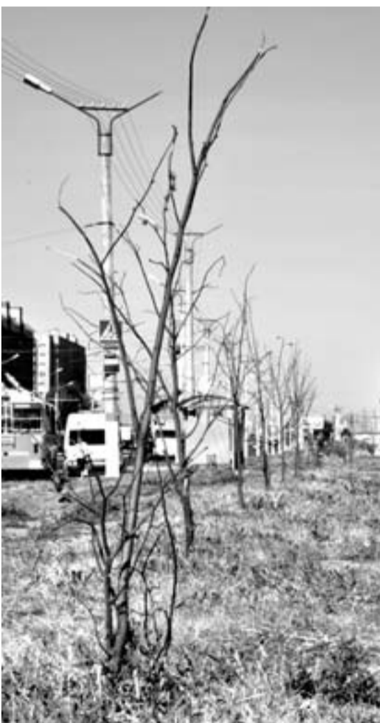
ТОЛЬКО БЕЗДУШИЕ ГУБИТ ДЕРЕВЬЯ.