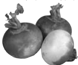
Подготовила Ольга ТЕРЕНТЬЕВА.

Эмульсия из семян. 1 столовую ложку семян растереть в ступке пестиком с постепенным добавлением стакана кипяченой воды комнатной температуры. Детям при кори назначают по 1 чайной ложке 4 раза в день, а для полоскания горла разбавляют в 2 раза горячей водой и применяют 3-4 раза в день.