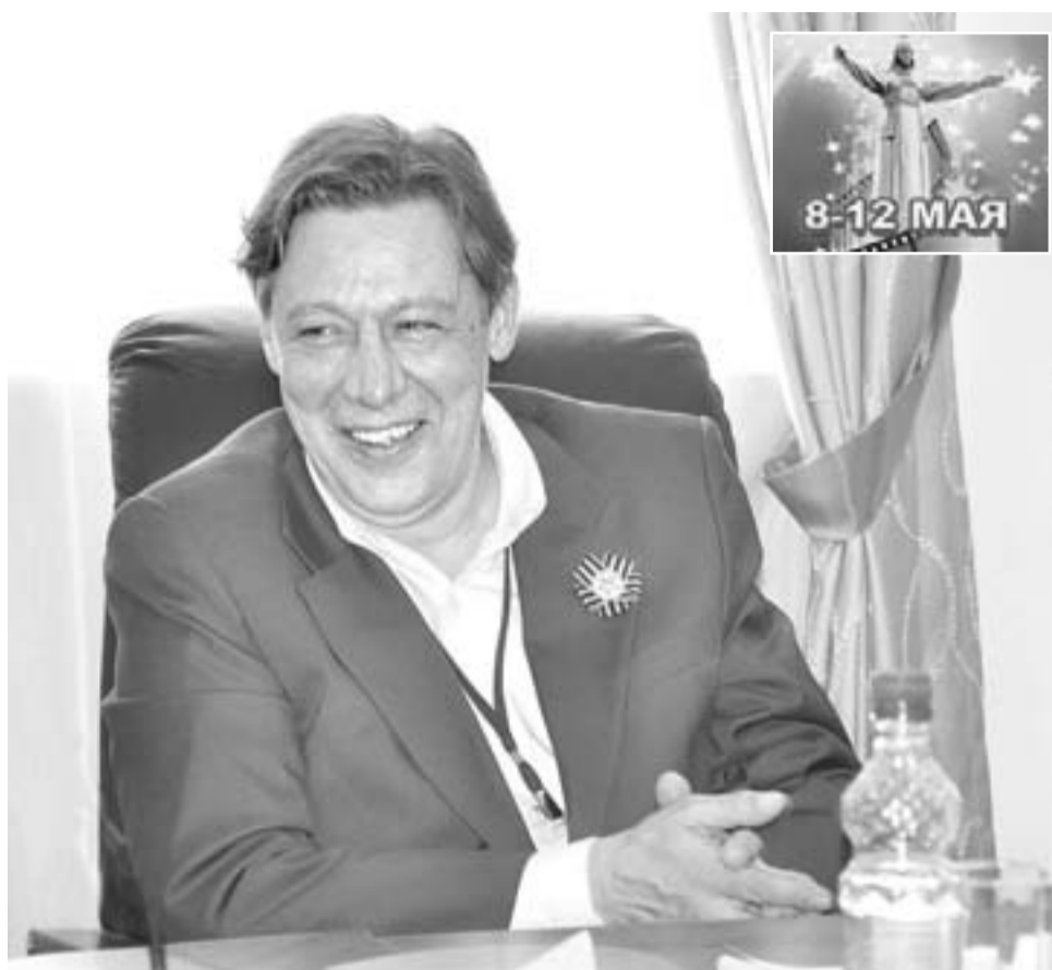
ЗАСЛУЖЕННЫЙ АРТИСТ РОССИИ МИХАИЛ ЕФРЕМОВ.

— Я не впервые в Чебоксарах, по этим местам уже ездил. В первый раз попал сюда в 12 лет — с мамой на круизном теплоходе по Волге. Помню, как в Чебоксарском порту нас встретили на черных “Волгах”. Я понял: “О-о, мы потомки почитаемого в Чувашии человека”.