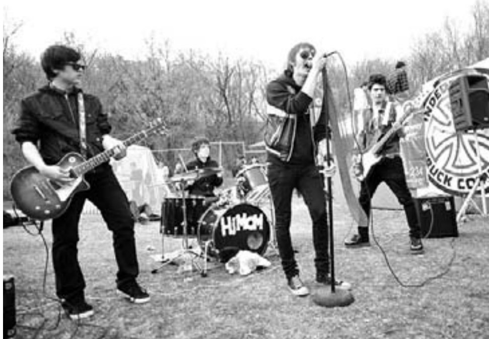
КОНЦЕРТ НА СОРЕВНОВАНИЯХ ПО СКЕЙТБОРДУ В ЧЕБОКСАРАХ.

Андрей: Ребята, которые думают в том же направлении, что и мы, имеющие желание и минимальные музыкальные задатки, в Чебоксарах нам пока не встре-