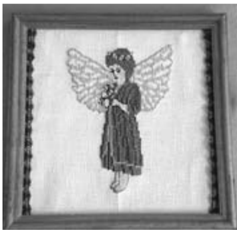
"АНГЕЛ". РАБОТА УЧЕНИЦЫ 6-ГО КЛАССА РЕСПУБЛИКАНСКОЙ КОРРЕКЦИОННОЙ ШКОЛЫ № 3.

Приносите свои работы в редакцию газеты по адресу: ул. Советская, 14а или присылайте фотографии работ по электронной почте pavlova@grani21.ru . Итоги конкурса подведем в конце года. Удачи!