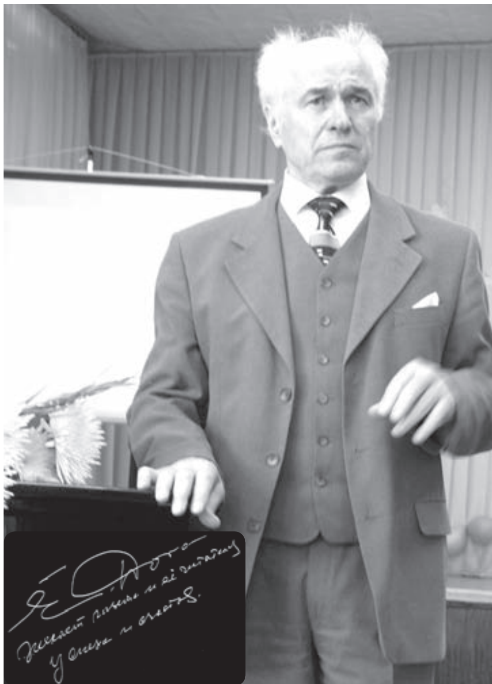
КОМПОЗИТОР ЕВГЕНИЙ ДОГА.

Знаменитый вальс из фильма “Мой ласковый и нежный зверь” каждый может узнать уже по первым нотам. После выхода на экраны фильма Евгений Дога — автор музыки — в одночасье стал одним из самых известных композиторов на всей территории Советского Союза. Лучше всех об этой чудесной мелодии, пожалуй, сказал режиссер Эмиль Лотяну: “Вальс на озере — живой нерв фильма... тончайшая паутина звуков, сотканная из грез и былей, порывов и предчувствий...” Как ни странно, о мелодиях, написанных к другим фильмам, теперь уже можно сказать этими же словами. Вспомните “Марию Мирабелу”. Из тех, чье детство пришлось на 80-е, вряд ли найдется один, не знающий слов песенки из этого фильма. “Табор уходит в небо”, “Анна Павлова”, “Одиноким предоставляется общежитие”, “Валентин и Валентина”, “Королева Марго” и другие... На прошлой неделе Евгений Дога посетил Чувашию. 73-летний композитор за один день побывал в Чебоксарах и Ядрине. На встрече с преподавателями и студентами Чебоксарского педагогического колледжа он исполнил свои знаменитые мелодии и рассказал о себе, своем творчестве.