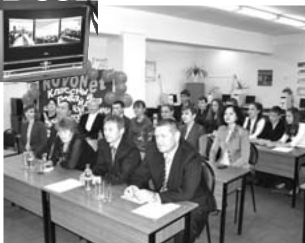
ВО ВРЕМЯ ВИДЕОКОНФЕРЕНЦИИ.