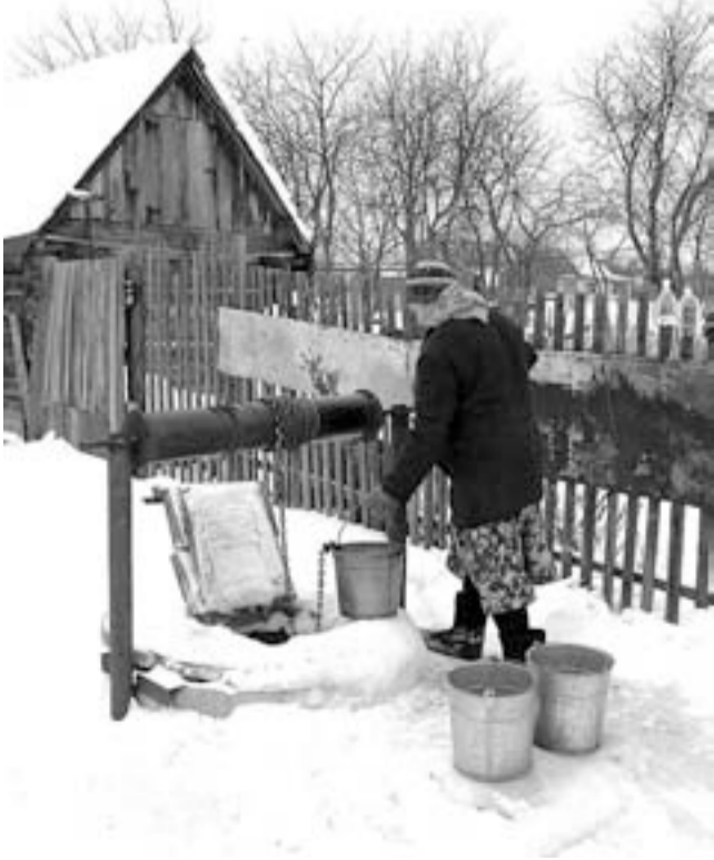
колодец, колодец, дай воды напиться...

ЛУНА: НОВОЛУНИЕ 16 МАРТА. НЕБЛАГОПРИЯТНЫЕ ДНИ: 16 МАРТА (0.00-4.00), 17 МАРТА (8.00-11.00).