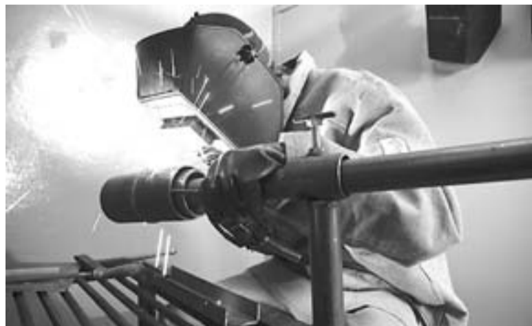
НЕТ РАБОТЫ? ЕСТЬ РЕМОНТ!

Предприятие троллейбусного транспорта включилось и в другое направление программы занятости — организацию стажировок для выпуск-