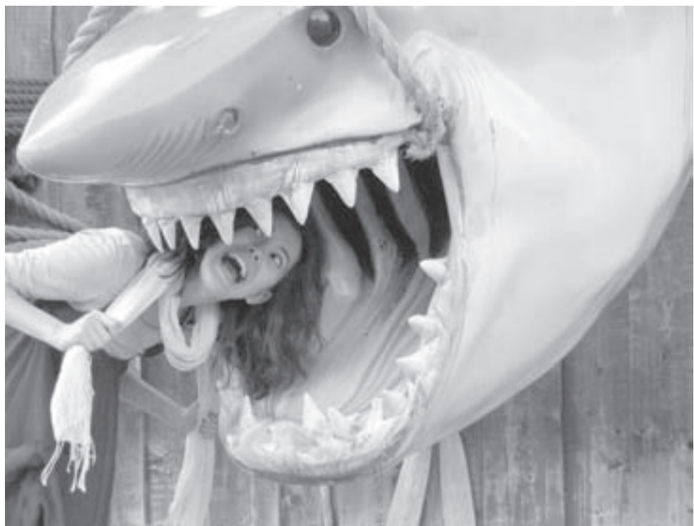
НА КИНОСТУДИИ "ЮНИВЕРСАЛ СТУДИО". АВТОР В ЗУБАХ У ПЕРСОНАЖА ФИЛЬМА "ЧЕЛЮСТИ".

Нью-Йорк поразил нас своей высотой. Когда выходишь из метро, поднимаешь голову наверх и не видишь, где заканчиваются здания — это производит впечатление! С погодой повезло: в основном было солнечно и довольно тепло. Даже сами